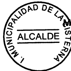
MANUEL LEON ITURRIETA ALCALDE (S)