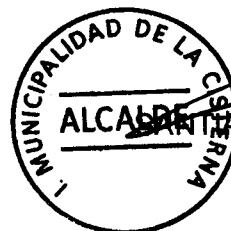
ALCALDE ANTONIO REBOLLEDO PIZARRO ALCALDE