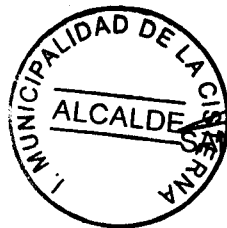
SANTIAGO REBOLLEDO PIZARRO ALCALDE