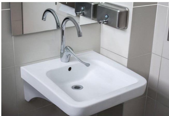
Lavamanos para discapacitados.