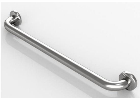
Barra fija para baño.