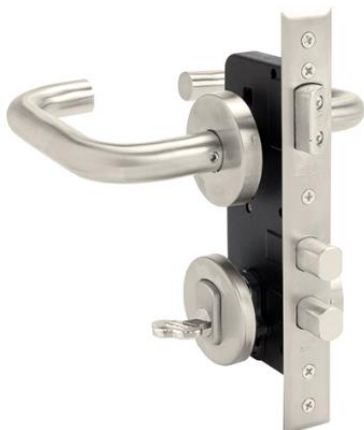
Cerradura para puertas.